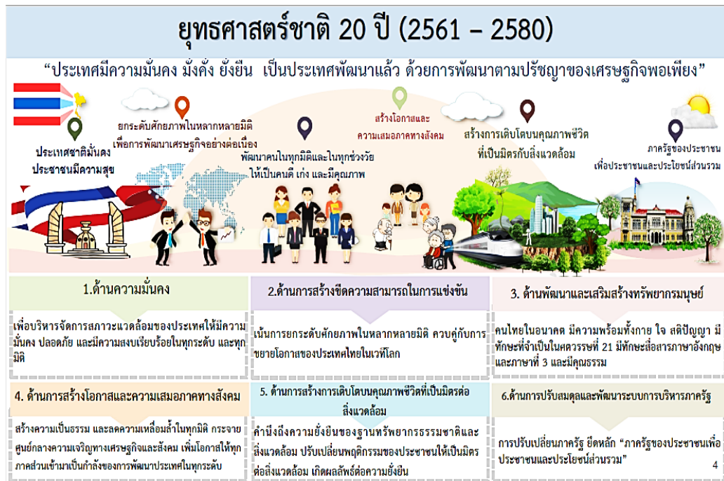
ภาพที่ ๒.๑ : ภาพยุทธศาสตร์ชาติ (พ.ศ. ๒๕๖๑ – ๒๕๘๐)