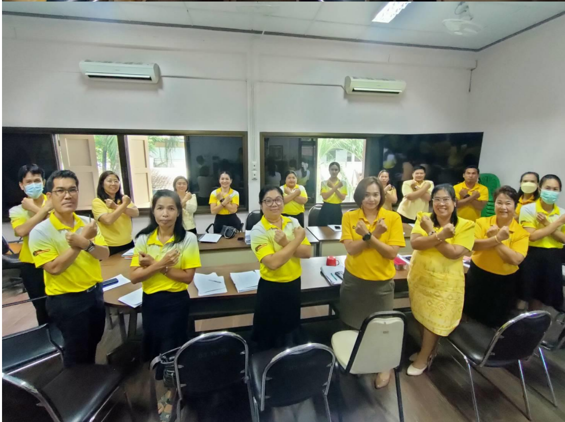
การประชุมวางแผนการทำงานการส่งเสริมคุณธรรม จริยธรรม ในโรงเรียน