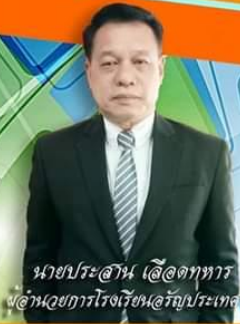
นายประธาน ใต้ดงทหาร ผู้อำนวยการโรงเรียนอรัญประเทศ

พัฒนาผู้เรียนให้มีความรู้ทันโลกในศตวรรษที่ 21